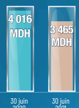
Chiffre d'affaires consolidé